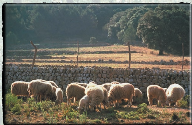
Ramaderia extensiva a la Serra de Tramuntana: encara continua.