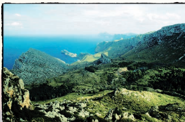
Penya-segats de la costa nord: un espai que resisteix.

Una empresa o una institució amb afany de lucre pot contribuir amb les iniciatives de les entitats de custòdia i amb els propietaris per a la conservació. Perquè la conservació de valors naturals, culturals i del paisatge és una inversió per a les empreses i societats que alhora reforcen la seva dimensió i imatge social.